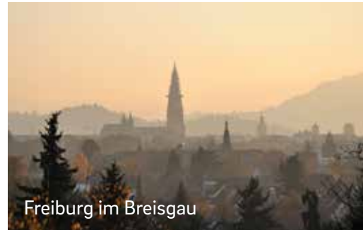
Freiburg im Breisgau