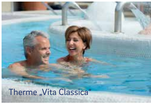
Therme „Vita Classica“