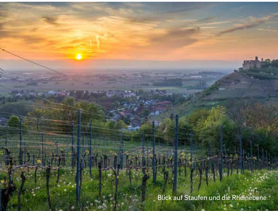
Blick auf Staufeu und die Rheinebene