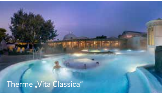
Therme „Vita Classica“